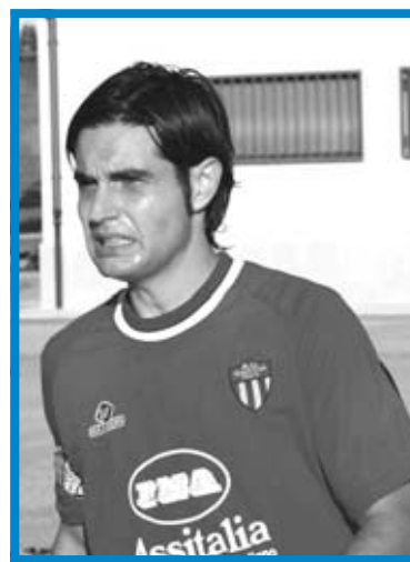
BELCASTRO La sua rete ha portato al successo il Bastia contro il Campitello

audacia inventandosi una formazione inedita quanto efficace, si sono espressi al meglio aggredendo gli avversari dall'inizio e pervenendo alla prima rete con una prodezza di Bordichini. Servito al 6' da Frenquelli Bordichini, da circa 25 metri, ha calibrato un pallonetto perfetto che si è insaccato alle spalle