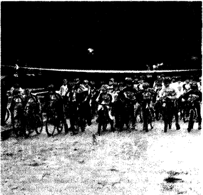
La partenza di una gara di minicross

PERUGIA - Il ciclismo umbro di nuovo protagonista in questo fine settimana. Si svolgeranno, infatti domani a Borgo di Trevi ben due gare a dimostrazione dell'attività incessante garantita dalle varie società ciclistiche. La prima è la quarta prova Umbria Master Cross, valevole per il primo Trofeo Us. Bovara mentre la seconda corsa in programma riguarda la terza prova Umbria minicross. Entrambe le competizioni saranno organizzate dalla società sportiva Us. Bovara Punto Bici. Il circuito su cui i corridori si daranno battaglia sarà quello antistante lo stadio comunale "S. Antonini" da ripetere come da regolamento più volte. Sicuramente saranno numerosi gli atleti che parteciperanno alle competizioni soprattutto nel minicross che sta mettendo in evidenza tanti piccoli campioni in erba. Ci si aspetta, come sempre anche molto pubblico pronto ad incoraggiare e far senti-