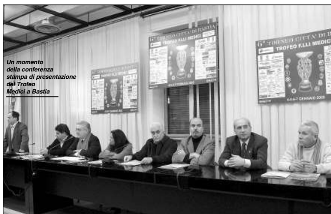
Un momento della conferenza stampa di presentazione del Trofeo Medici a Bastia

GIRONE A: Juventus F.C., A.C. Fiorentina, F.C. Internazionale, F.C. Zenith GIRONE B: Atalanta B.C., Glasgow Rangers, F.C. Liverpool, Bastia S.G. GIRONE C: A.S. Roma, A.C. Milan, F.C. Empoli, F.C. Fresca