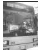
Apm, corse limitate per le festività

PERUGIA - Queste le modifiche del servizio Apm per Natale e Santo Stefano. Natale: Linea 1, Linea 2, Linea 9 normali orari festivi. Linea 8 collegamento fra Ospedale Silvestrini - Piazza Italia e viceversa con frequenza 60 minuti. Scale mobili: apertura al pubblico dalle 9 alle ore 21, 45. Chiusi gli ascensori. Servizio extraurbano: sospesa la linea Perugia-Assisi e Perugia-Gualdo Tadino. Linea extraurbana Perugia-Gubbio: normali orari festivi. Linea extraurbana Gubbio-Fossato di Vico-Gualdo Tadino: vengono garantite due coppie di corse. Linea extraurbana Gubbio-Mociana: servizio sospeso. Per Santo Stefano Apm effettuerà i servizi secondo il normale orario festivo. Per informazioni rivolgersi al numero verde 800512141.