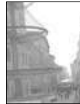
Tanti appuntamenti a Perugia

PERUGIA - Queste alcune delle iniziative previste per oggi a Perugia. Alberi della gioia a Corso Cavour (dalle 17 alle 19), dove è possibile lasciare ai piedi degli alberi di Natale un regalo per i bambini ricoverati all'Ospedale Silvestrini. Babbo Natale in carrozza, invece, ripercorrerà l'antica voltata delle carrozze (Via Podiani) e ritirerà tutti i doni da portare ai bambini ricoverati all'Ospedale Silvestrini (ore 19). Ex borsa Merci Via Mazzini: I bambini di largo Unicredit "I Cantastorie" in un lettura teatrale. Palazzo dei Priori - Sala dei Priori. Alle 21, a Palazzo della Penna, la rassegna di film "La morte corre sul fiume". Da ricordare, infine, gli auguri del sindaco alla città alle 18,30 a Palazzo dei Priori e VenereClassic in concerto