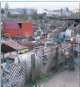
Una delle discariche sequestrate

La finanza sequestra quattro mega discariche abusive