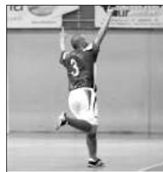
L'esultanza di un giocatore della Coar

Continua il cammino di questa Coar, che mantiene il primo posto in classifica ed in questa circostanza era importantissimo farlo visto che per sabato si annuncia un big match con il Colleferro, prima squadra a battere la Coar all'andata, ma soprattutto assolutamente rinnovata e rinforzata con vari innesti di altissimo livello. I dirigenti rupestri si aspettano dunque che i tifosi accorcano numerosi per sostenere la Coar in questo importantissimo appuntamento.