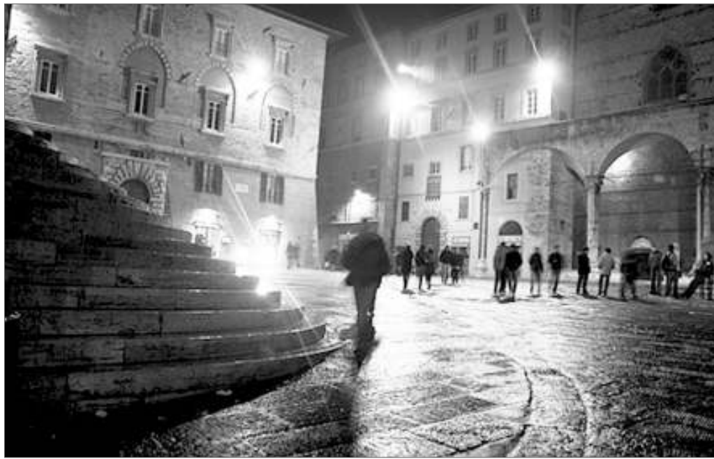
Piazza IV Novembre a Perugia vista di notte