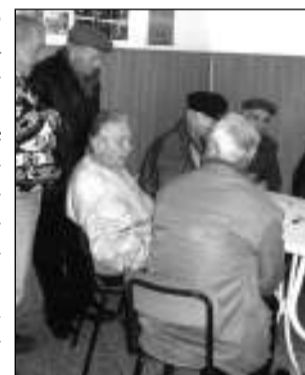
Anziani passano il tempo al circolo

Per informazioni rivolgersi all'ufficio cittadinanza del Comune di Bastia Umbra nei giorni di ricevimento al pubblico: lunedì, mercoledì e venerdì dalle ore 9 alle 13; il martedì e il giovedì dalle 15,30 alle 17,30.