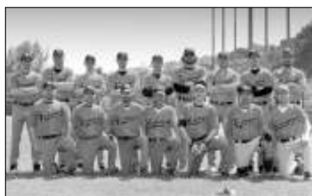
La formazione della Fortebraccio Perugia

zioni che hanno dominato il campionato, con due sole sconfitte su 13 turni, la Fortebraccio Baseball Perugia e la Marconi Spoleto. Il derby, che all'andata vide prevalere i grifoni per 11 a 6, si sarebbe dovuto tenere a Spoleto ma, vista l'importanza del match e l'obiettiva criticità del campo spoletino (in realtà un campo da calcio riadattato), si disputerà a Perugia su proposta della stessa Marconi Spoleto. In un match senza prove d'appello la vincente si aggiudicherà il pri-