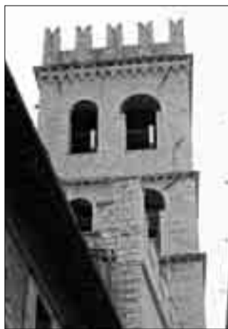
S'attende il commissario

ASSISI - Un Natale da dimenticare per il centrosinistra assisano. Il nodo delle primarie continua a far discutere. La scelta del candidato a sindaco crea non pochi problemi tra i partiti dell'Unione. E all'interno degli stessi schieramenti politici. Mentre il "Comitato per le primarie" sembra voler accelerare i tempi di organizzazione e realizzazione di una larga consultazione popolare per la scelta di un candidato alla poltrona di primo cittadino, ipotesi di ripescaggi nelle fila del centrodestra dissidente si fanno strada. Non senza polemiche. Se, infatti, alcuni degli esponenti dei maggiori partiti dell'Unione si dichiarano fin da ora contrari a una scelta oltremodo "singolare" e quantomai "coraggiosa", sembra che dal capoluogo (e non solo) si spinge sulla nomina di un dissidente dell'Udc come candi-