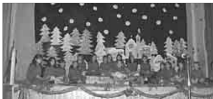
Due momenti della deliziosa recita

In pantaloni blu e casacca rossa con lo stemma dorato del Convitto, invece, gli alunni di terza, quarta e quinta elementare, che hanno rappresentato una "Storia natalizia in Assisi" recitata e cantata. Ambientata in piazza del comune tra il Tempio di Minerva e la Volta pinta, è la storia "di tanti anni fa" di un gruppo di bambini che - la