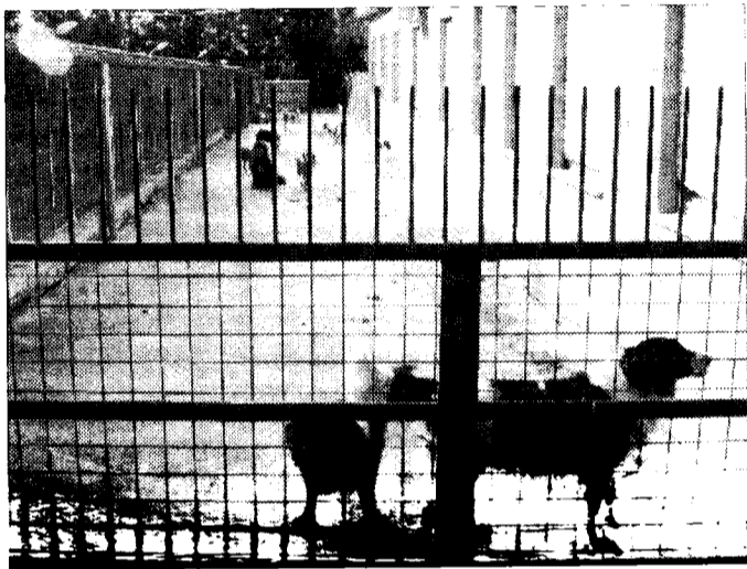
In cerca di un gestore Super lavoro per il canile