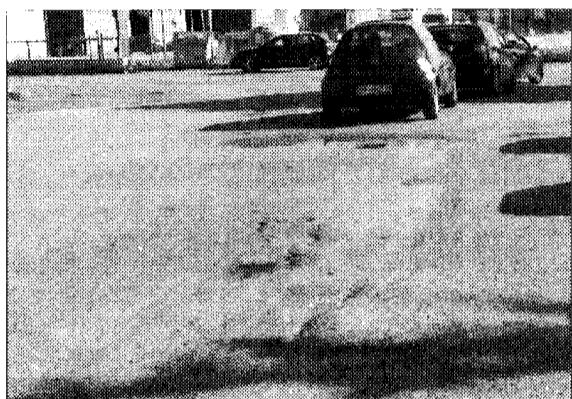
Buche e strisce scomparse Gli attraversamenti erano stati ridipinti di recente

Che la manutenzione delle vie di Bastia Umbra sia da rifare non è di certo una novità. La stessa giunta uscente ne aveva preso atto, deliberando il rifacimento dell'asfaltatura di via Roma, che, sebbene nel corso dei lavori avesse sollevato delle lamentele per i rumori provocati nel corso delle ore notturne, ha notevolmente giovato alla viabilità. Purtroppo, ciò che rimane da fare è ancora tanto. In modo particolare, ci sono una marea di manti stradali sconnessi, con buche enormi che impediscono la scorrevole circolazione dei mezzi, sia automobilistici che a due ruote. La causa del disagio, che potrebbe diventare anche pericoloso, in alcuni casi è dovuta alle tubature sottostanti, in altri a radici arboree cresciute a dismisura. Esteso l'elenco delle vie con questo tipo di problema; la più disastrosa delle altre è, probabilmente,