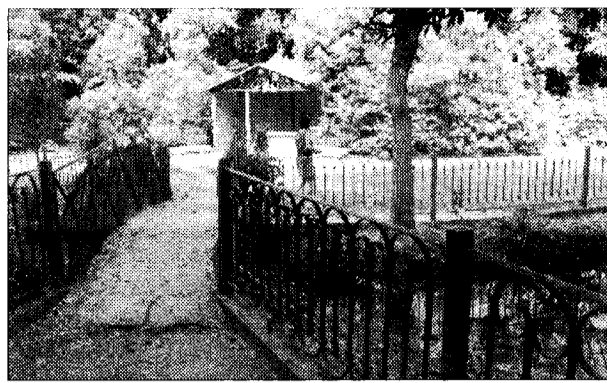
Riapertura del Pincio E' stata avviata una raccolta firme da parte dell'Udc

dall'amministrazione l'erogazione di un servizio pubblico che essa è tenuta a garantire". La scoperta della chiusura del Pincio era stata fatta a gennaio da alcuni cittadini che, approfittando di temperature miti, avrebbero voluto portare i loro figli al parco: motivo della 'serrata', il bando di selezione per la gestione del parco andato deserto, anche se il Comune resta in attesa di qualcuno che garantisca l'apertura e la disponibilità a gestire - almeno nella stagione estiva - alcune attività in una zona che peraltro è rientrata in "un progetto di