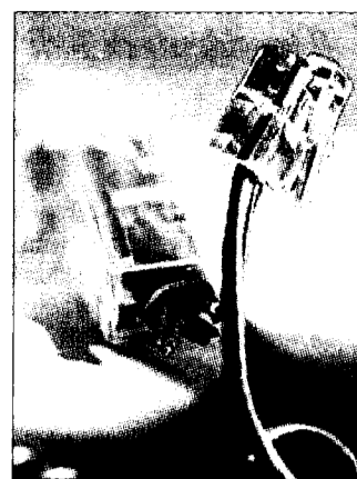
Se il telefono è fonte di disagi

BETTONA - (a.s.) Giorni fa evidenziamo su queste colonne le difficoltà con cui era costretta a confrontarsi una giovane azienda, peraltro in continua e vistosa crescita, la Top Melon, perché a fronte di richieste iniziate circa sei mesi fa non aveva ancora avuto la disponibilità di una linea telefonica.