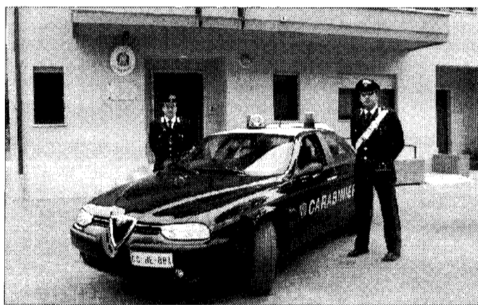
Una garanzia Il controllo del territorio assicurato

ASSISI - Controlli coordinati contro le stragi del sabato sera e controlli del territorio per contrastare l'uso di sostanze stupefacenti, sono al centro dell'attività dei carabinieri delle stazioni di Bastia Umbra (coadiuvati dal radiomobile di Assisi) e Santa Maria degli Angeli. Questi ultimi, in particolare, hanno arrestato un albanese 30enne, colto sul fatto (nella notte tra venerdì e sabato) mentre stava vendendo una dose di cocaina nella centralissima via Risorgimento. Ad aiutare i militari, è intervenuta la forte pioggia abbattutasi sul territorio nella notte: i carabinieri si erano appostati in borghese nella via e hanno atteso i movimenti dell'uomo - da tempo tenuto sotto osservazione - riuscendo ad osservare da brevissima distanza, pochi metri, tutta la sequenza dello spaccio. Al momento più opportuno, i militari angelani sono intervenuti e hanno arrestato lo straniero, che - anche grazie alla pioggia - non si era accorto della loro presenza. Per l'uomo l'accusa è di spaccio di sostanze stupefacenti, con tanto di rito direttissimo di convalida svoltosi ieri. Sul fronte del contrasto al "triste fenomeno" delle stragi del sabato sera, invece, i controlli condotti dai carabinieri della stazione di Bastia Umbra hanno portato al ritiro di ben sei patenti con relative denunce per guida sotto effetto di sostanze alcoliche: i guidatori - tutti controllati al di fuori dei locali di Bastia Umbra e trova-