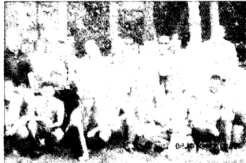
Un anno fa Flash dalla prima edizione