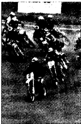
Tutti in corsa