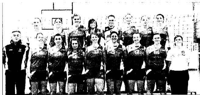
Piccole ma tenaci Le Green del Volleyball Tiferno