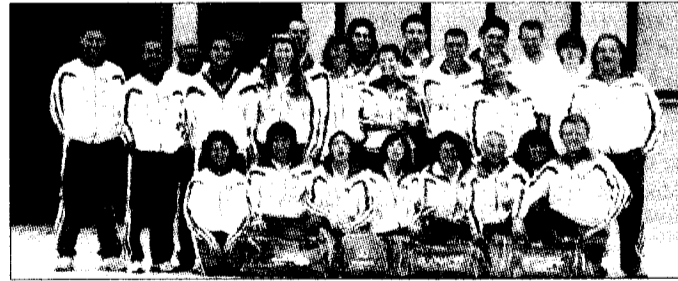
In prima linea Gli atleti del Centro Nuoto Alto Tevere

Per l'Umbria scenderanno in piscina le squadre di Città di Castello del Centro Nuoto Alto Tevere Cnat '99 e del Tiferno Nuoto, la Polisport Srl di Gubbio, l'Umbria