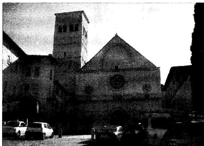
Ristrutturata C'è chi teme che la piazza si possa rovinare

ASSISI - Una lettera recapitata all'ufficio protocollo del Comune di Assisi per chiedere, a chi di competenza che la piazza del sagrato di San Rufino non sia, come troppo spesso accade, un parcheggio a cielo aperto. Firmato, il generale Franco Caldari, già assessore alla polizia municipale che ha deciso di farsi portavoce delle istanze numerosi cittadini che vorrebbero una piazza più vivibile e senza auto. "In molti, spiega Caldari, mi hanno presentato le loro lamentele per il parcheggio indiscriminato che le auto fanno davanti a San Rufino, una piazza che non è solo degli assisani, ma che spesso - grazie anche ad uno dei più bei monumenti romani dell'Italia centrale - attira anche i turisti, che non possono fotografarla degnamente vista la presenza di auto in ogni 'buco' disponibili". A