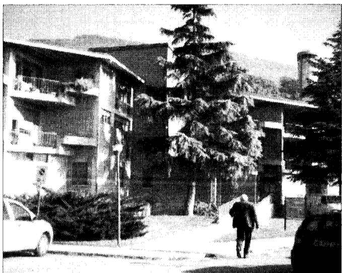
Tempi di attesa A ospedale, sedi Asl e poliambulatori

Tempi molto lunghi anche per ecografia ginecologica e visita ginecologica; ben 52 giorni di attesa