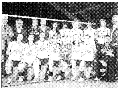
Regine In alto la squadra Under 16 e le ragazze dell'Under 18 della Media Umbria