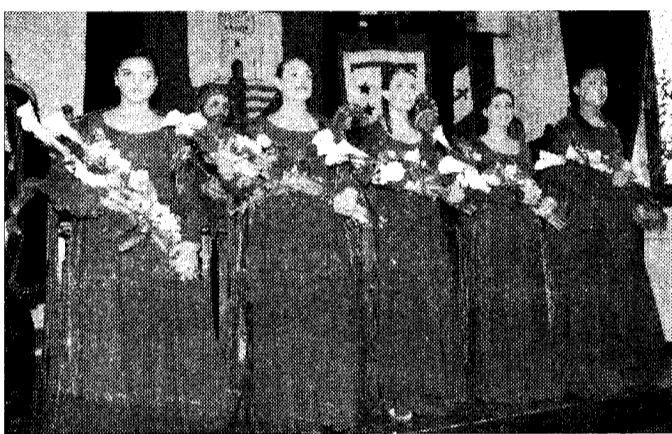
Fanciulle in fiore A sinistra le cinque Madonne della Parte de Sopra, a destra quelle della Parte de Sotto