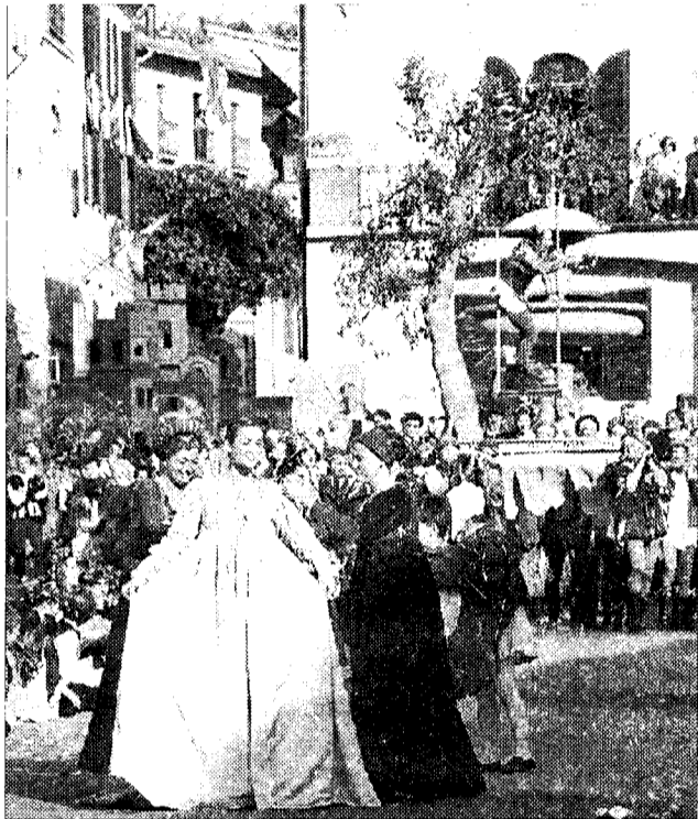
Calendimaggio Ci siamo

E' un primo assaggio di Calendimaggio oggi pomeriggio alle 18, quando la Nobilissima Parte de Sopra e la Magnifica Parte de Sotto faranno sfilare in un breve corteo le giovani che hanno scelto per rappresentare il lato più poetico della manifestazione che si svolgerà giovedì 7, venerdì 8 e sabato 9 maggio. Madonna Primavera sarà eletta tra le dieci fanciulle in base ai risultati dei giochi medievali che si terranno nei primi due giorni della festa; le gare, al meglio delle tre, sono il tiro con la balestra, il tiro alla fune e la corsa della treggia, una sorta di antico carro utilizzato nei lavori contadini. La presentazione avverrà nella piazzetta della Chiesa Nuova; in caso di maltempo, la manifestazione si terrà comunque nella sala della Conciliazione del palazzo comunale. In un omaggio alle dieci madonne si esibirà il coro dei cantori di Assisi, diretti da padre Maurizio Verde.