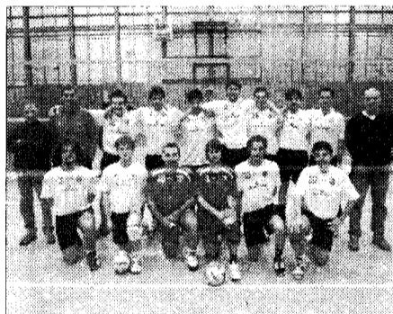
La Wienerberger Ternana

Le "superstiti" Restano in serie C: Rpa LuigiBacchi.it Perugia, Horizonsoftware Tetrastem Clitunno e Gherardi Cartoedit Città di Castello.