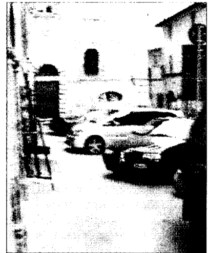
Via San Paolo Uno spazio difficile

L'eliminazione di alcuni posti auto continua comunque a contrariare diversi residenti e commercianti di via San Paolo, che oggi si dicono "arrabbiati perché qui viviamo e lavoriamo pure noi". Il problema parcheggio è stato fatto presente anche nel corso dell'ultimo incontro tra comune e cittadini svoltosi lunedì ad Assisi. In quell'occasione, il sindaco Ricci aveva promesso che l'assessore Brunozzi ed il comandante dei vigili urbani si metteranno al lavoro per cercare di capire se è possibile il ripristino di alcuni dei posti attualmente eliminati.