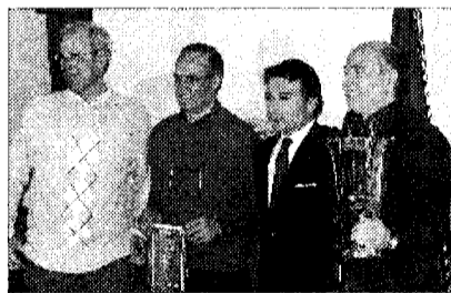
La premiazione con i membri Fitel e l'assessore

ASSISI - Negli impianti comunali di Viole d'Assisi si è tenuta la prima edizione del "Torneo FITel di calcio a 5", con la partecipazione di oltre 200 persone tra atleti ed accompagnatori provenienti da Piemonte, Lombardia, Liguria, Campania e naturalmente Umbria. Un evento che ha arricchito le attività sportive della FITel e che dato modo ad Assisi di ospitare un gruppo nutrito di persone che, collateralmente al torneo, da giovedì a sabato si sono dedicati alla conoscenza del territorio e alla scoperta del suo patrimonio culturale.