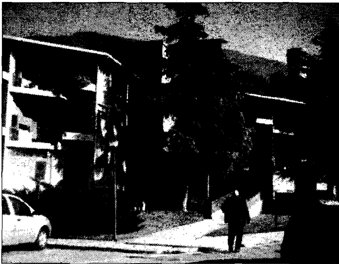
Tema caldo Sì all'indirizzo di geriatria e alla riabilitazione