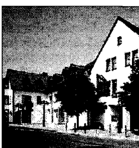
Un angolo di Hochberg