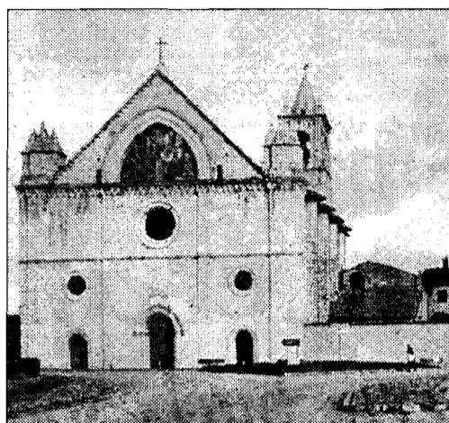
Santuario Rivotorto Uno dei cantieri più attesi che dovrebbe prendere il via entro la prossima primavera