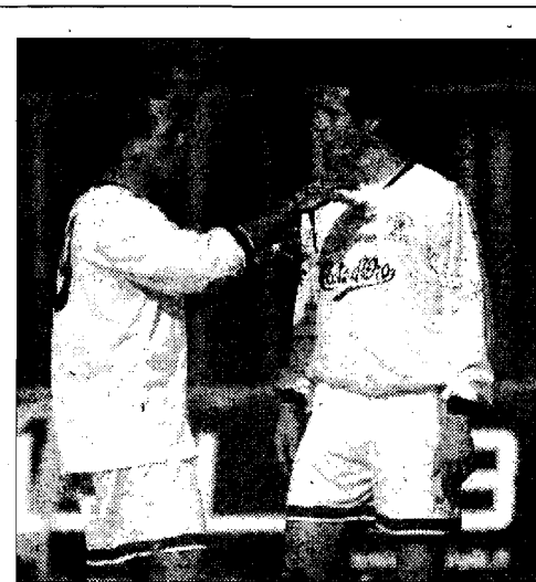
Papatolo catechizza il compagno

Romeo espulso: "L'arbitro ha visto male". Marchetti al rientro: "Facile giocare così"