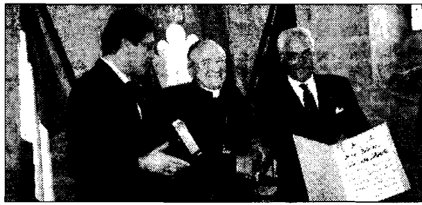
Premio Bandiera La consegna dell'attestato al cardinale Ennio Antonelli

GUBBIO - "Gubbio è il mio passato che non passa e che si ravviva ogni volta che torno". Il cardinale Ennio Antonelli ha ricevuto ieri mattina il "Premio Bandiera 2008", riconoscimento che il gruppo degli Sbandieratori ogni anno assegna a chi ha contribuito alla valorizzazione della città. Antonelli è stato vescovo di Gubbio dal 1982 al 1988, poi arcivescovo a Perugia e Firenze, segretario generale della Cei, ora presidente del Pontificio Consiglio per la famiglia. Molto amato dagli eugubini, che non lo hanno mai dimenticato. "L'energia che ci ha contraddistinto di generazione in