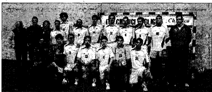
Corazzata L'Italtchimici Foligno punta in alto