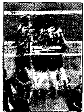
La Sirio è in forte risalita

PERUGIA - Il popolo della Sirio ha risposto in massa e un pullman è già stato riempito senza troppa fatica. Così, per il turno infrasettimanale del campionato di A1 femminile che il giorno dell'Epifania la vedrà impegnata sul campo delle rivali di sempre della Scavolini Pesaro, la Despar Perugia potrà contare anche sull'apporto dei suoi tifosi.