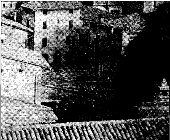
Cannara Polemiche sulla provinciale che la collega