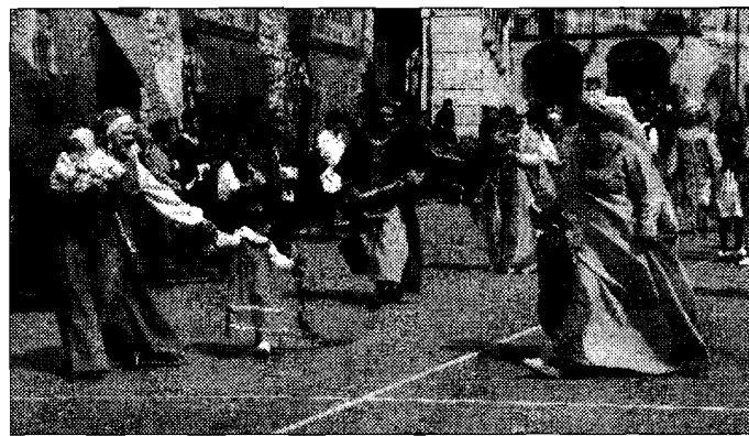
Calendimaggio Nodi da sciogliere per i partaioli