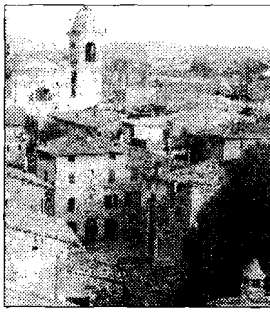
Il centro storico

CANNARA - Tante opere per rendere Cannara ancora più bella e ricca di spazi per i cittadini, per la cultura e il sociale. Il sindaco Giovanna Petrini fa il punto su alcune attese opere in corso e iniziative di ogni genere, di tipo sportivo e culturale, che arricchiranno la vita del piccolo comune. In primo piano, la restituzione ai cittadini contenitori importanti, come il museo presso l'ex convento delle Salesiane, che fra poco verrà inaugurato. "Finalmente - spiega il sindaco - confluiranno nel museo tutti i reperti archeologici ritrovati durante le campagne di scavo nei dintorni, tra cui l'importante mosaico che è stato esposto a Roma. Si tratta di un appuntamento al quale teniamo particolarmente, perché abbiamo dedicato molti fondi del terremoto ed europei per permettere il restauro della struttura". Oltre al museo, un altro edificio importante verrà riaperto, l'ex mattatoio, all'interno del quale verrà realizzato un archivio storico comunale che raccoglierà anche i documenti del comune di Cannara che attualmente sono custoditi a Perugia. Non solo cultura e arte, però, beneficeranno dei lavori, finanziati per buona parte con i fondi post terremoto: "Stiamo andando avanti con la ri-