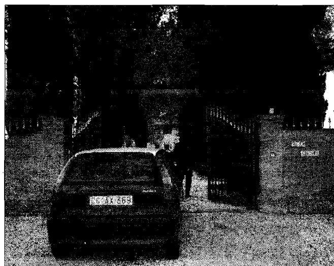
Villa Bartolini Una settimana fa il sequestro e la rapina

potrebbe essere un basista, che avrebbe accompagnato i compagni nella villa, ma che poi non li avrebbe seguiti nella fuga verso la zona marchigiana tra Colfiorito e Annifo. Il fatto che il basista sarebbe rimasto nel territorio bastiolo e che, si è detto, potrebbe essere rimasto relativamente vicino alla famiglia Bartolini, sta suscitando non pochi suggestioni tra i cittadini di Bastia Umbra. In particolare modo le ipotesi che vogliono che il basista abbia conosciuto per qualche motivo la famiglia Bartolini e che, per questo, abbia indossato ben due passamontagna e non abbia mai proferito parola durante il furto, ha gettato imbarazzo tra i derubati e i loro conoscenti.