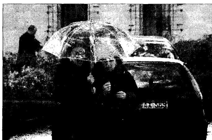
Clamore La rapina in villa sta facendo parlare