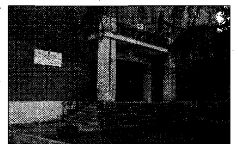
Chiesto un consiglio comunale ad hoc