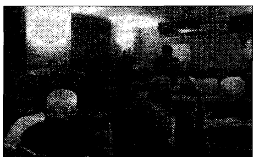
Festa angelana Saluto ai priori