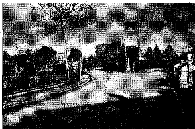
Chiuso per una settimana Passaggio a livello