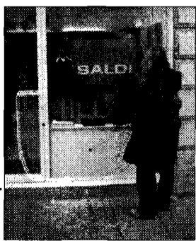
Saldi e polemiche