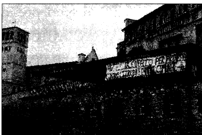
Protesta I lavoratori hanno appeso striscioni per richiamare l'attenzione pubblica