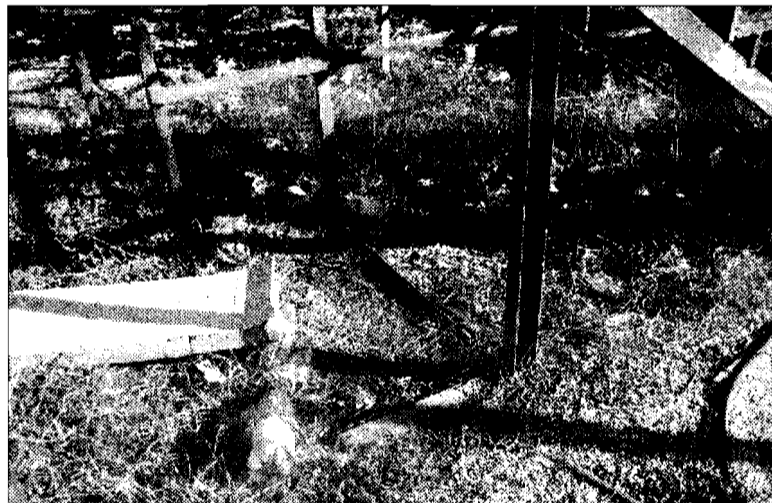
Panorama inquietante Ecco il cosiddetto "campo da tennis"

Insomma, attualmente il paesaggio castelnovese è molto distante dal disegno che lo studio Menichelli ha pre-