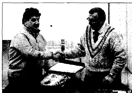
Alcune immagini della presentazione di ieri nella sala del Consiglio del Comune