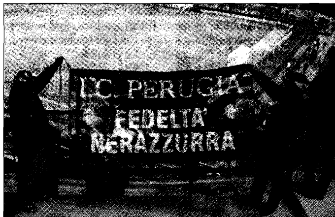
Con lo striscione sugli spalti del Meazza