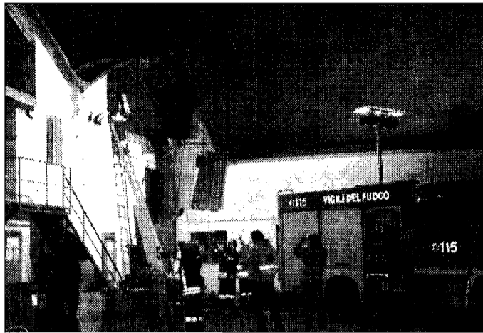
Pauroso incendio Nelle foto di Giancarlo Belfiore il capannone in fiamme e i vigili del fuoco in azione

BASTIA UMBRA - Un vasto incendio è scoppiato poco dopo le 21 di ieri sera al magazzino dell'azienda "Ellesse" ad Ospedalicchio di Bastia Umbra, con i vigili del fuoco del distaccamento di Assisi e Perugia che, allertati dagli abitanti della zona quando oramai le fiamme avevano già 'attecchito', hanno lavorato oltre due ore per domare le fiamme: tra le ipotesi vagliate dagli investigatori (cinque squadre dei pompieri, sul posto anche una pattuglia dei carabinieri) non viene esclusa quella che l'incendio possa essere, data l'estensione, di origine dolosa. Le indagini continueranno anche nella giornata di oggi, ma i danni, non ancora quantificati esattamente, sarebbero ingenti, con la struttura andata completamente distrutta; sempre nella giornata di stamattina, inoltre, i pompieri (che fino a tarda notte hanno lavorato per boni-