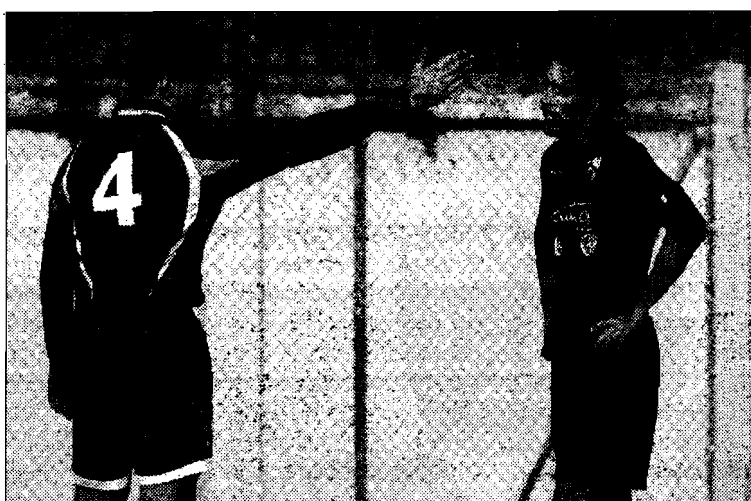
Pizzi a muso duro contro Lorenzo Tarpani, autore del 2-0