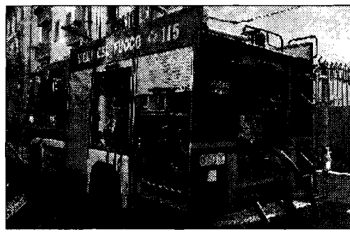
Soccorsi La famiglia trasferita in albergo

Lavori Pubblici del Comune: "Il crollo del muro è sicuramente avvenuto a causa delle violente piogge dei giorni scorsi, ma la situazione non da adito a particolari preoccupazioni, visto che il muro è franato in maniera compatta". Ulteriori controlli sono stati effettuati dal personale competente. "I vigili del fuoco infatti, nel minuzioso controllo effettuato non hanno