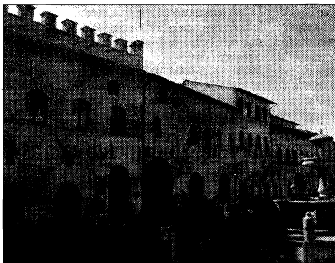
Clima rovente I partiti continuano a bisticciare