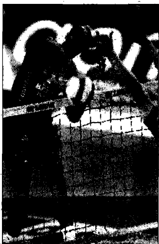
Amici contro il brasiliano Felizardo e l'azzurro Bovolenta

Sarà una sfida nella sfida quella tra Renato Felizardo e Vigor Bovolenta che si ritroveranno l'uno contro l'altro mercoledì prossimo a Monza, città scelta per l'edizione 2008 del Tim All Star Volley. La Nazionale azzurra affronterà una rappresentativa del Resto del Mondo composta dai miglio stra-