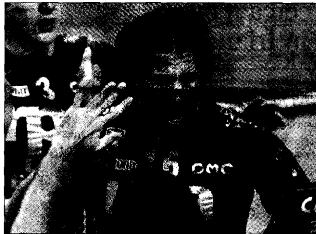
Azzurro dentro Vigor Bovolenta