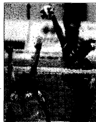
All'attacco Julius Sabo