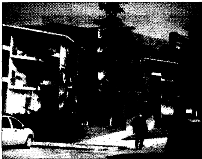
L'ospedale di Assisi. Attese ancora troppo lunghe

lonscopia resta uno degli esami con divario più grande dalla prenotazione al Cup al servizio; da 52 giorni a settembre si sale a 54. Da segnalare, dopo un momentaneo calo dell'attesa, la ripresa di "quota" dell'elettrocardiogramma holter: dai 74 giorni di luglio i tempi erano stati abbattuti a 24. Oggi si torna a 65. Tempi differenti a seconda delle priorità anche quelli riguardanti l'ecodoppler dei tronchi sovraortici, che in generale mantiene un buon servizio con attese che vanno dai 3 ai 19 giorni. Discorso diverso per l'ecodoppler dei vasi periferici, con 60 giorni di "liste". Rimangono tempi alti per l'esofagoduodenoscopia, 34 giorni, e per i raggi a cervello e tronco encefalico (35), mentre quelli a pelvi, prostata e vescica scendono ulteriormente a quota 15. L'ecogra-